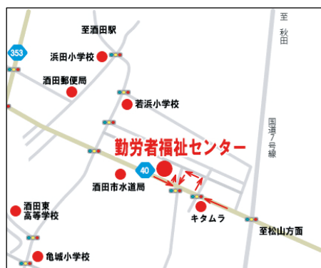
【説明・選考会会場案内図】